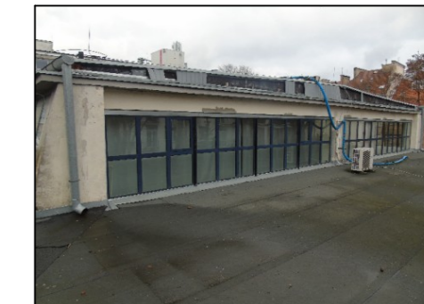
Fot.2 Widok ściany wyższej od południowego-wschodu