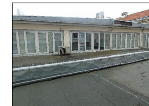
Fot.1 Widok ściany wyższej od północnego-zachodu

Wszystkie wymiary sprawdzić bezpośrednio na obiekcie.